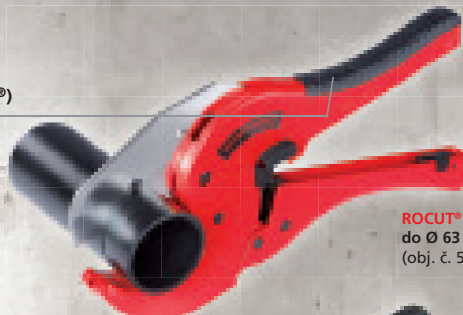
ROCUT® TC 63 do Ø 63 mm (obj. č. 52030)

Nerezová čepule zbrúšená do tvaru „V“ (u všech nůžek ROCUT®)