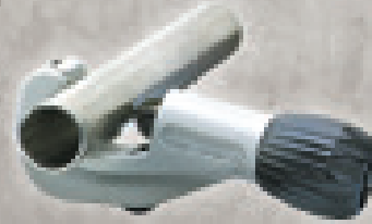
INOX TUBE CUTTER 35 (obj.č. 70055) INOX TUBE CUTTER 42 (obj.č. 70070)