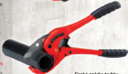
ROCUT® TC 75 do Ø 75 mm (obj. č. 52015)

Široká opěrka trubky (u všech nůžek ROCUT®)