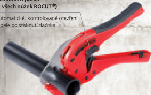
ROCUT® TC 42 do Ø 42 mm (obj. č. 52000)

Automatické, kontrolované otevření čepule po stisknutí tlačítka