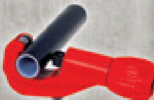
TUBE CUTTER 35 MSR (obj.č. 70108)