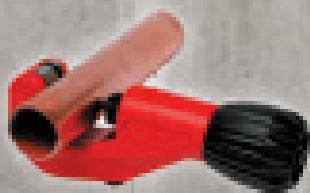
TUBE CUTTER 35 (obj.č. 70027) TUBE CUTTER 42 PRO (obj.č. 70029)