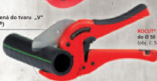
ROCUT® TC 50 do Ø 50 mm (obj. č. 52010)