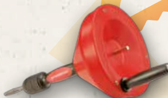
ROSPI H+E Plus 72095

Profesionální ruční i elektrická čistička.