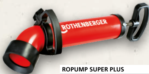
ROPUMP SUPER PLUS 72070X