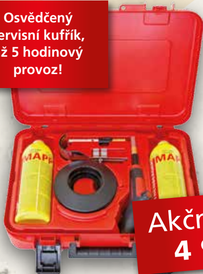
SUPER FIRE 4 HOT BOX Obj. č. 1000001264

Osvědčený servisní kufřík, až 5 hodinový provoz!