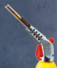
Rukojeť k SUPER FIRE 3 č. 35445