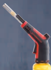
Rukojeť k SUPER FIRE 4 č. 150001354