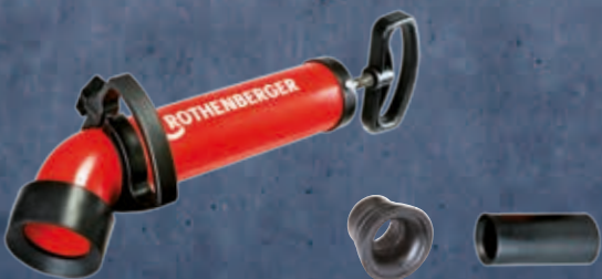
Krátký adaptér Dlouhý adaptér