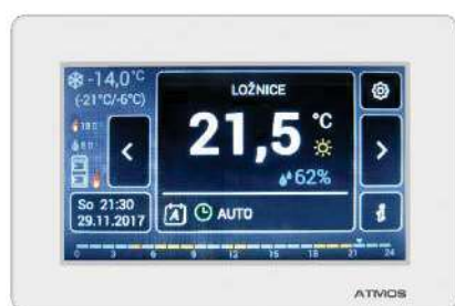
Pokožová jednotka ARU30 s dotykovým displejem