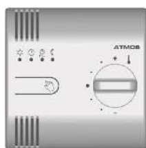
Pokožová jednotka ARU10