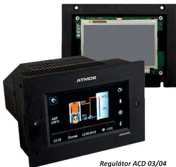
Regulátor ACD 03/04